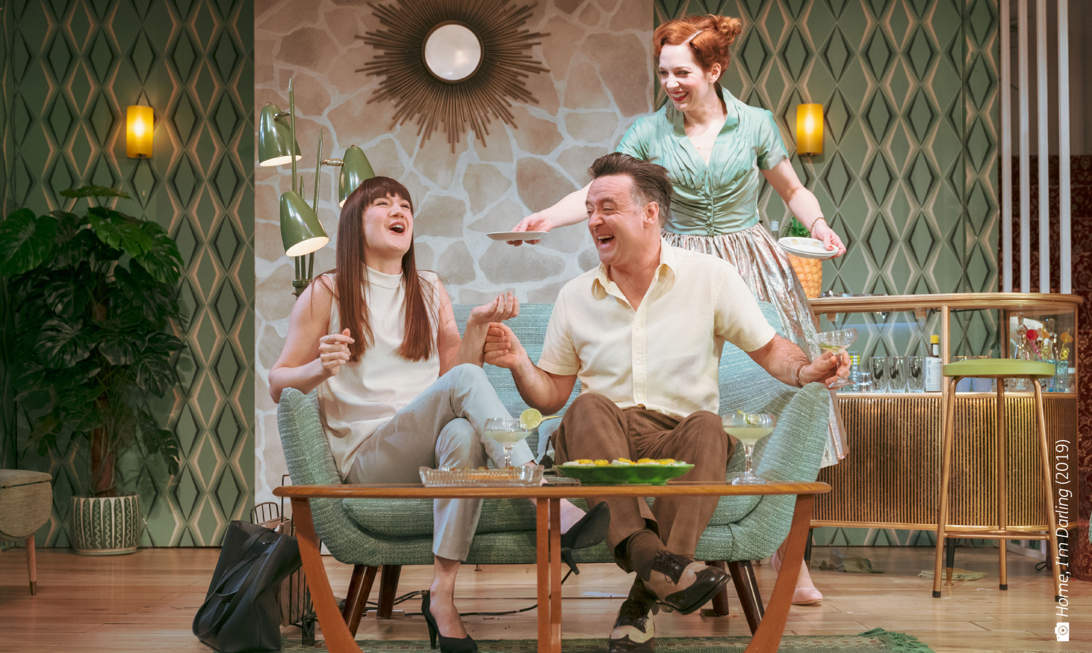
Home, I'm Darling (2019)