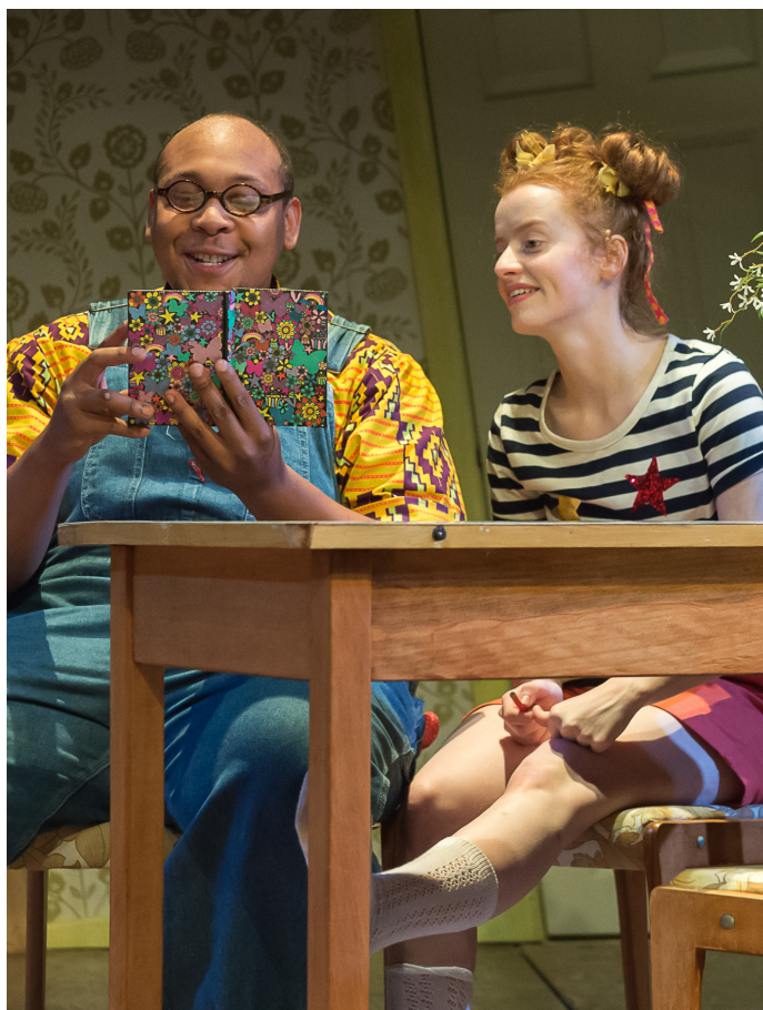
To Dream Again (2016)

Ni yw un o'r ychydig theatrau yn y DU sydd â thimau adeiladu golygfeydd, creu gwisgoedd, props a chelf golygfaol o hyd i gyd yn fewnol ochr yn ochr â'r timau goleuo, sain a llwyfan. Rydyn ni bob amser yn anelu at gynnis yr amgylchedd cynhesaf i dimau creadigol gynhyrchu eu gwaith gorau.